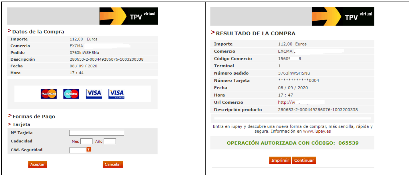
Figura 6. TPV – Paso 1

Després de prémer el botó de "continuar" de la figura 5 , l'aplicació ens redirigeix a la pàgina del TPV on s'introduiran les dades bancàries (veure figures 6 i 7 ).