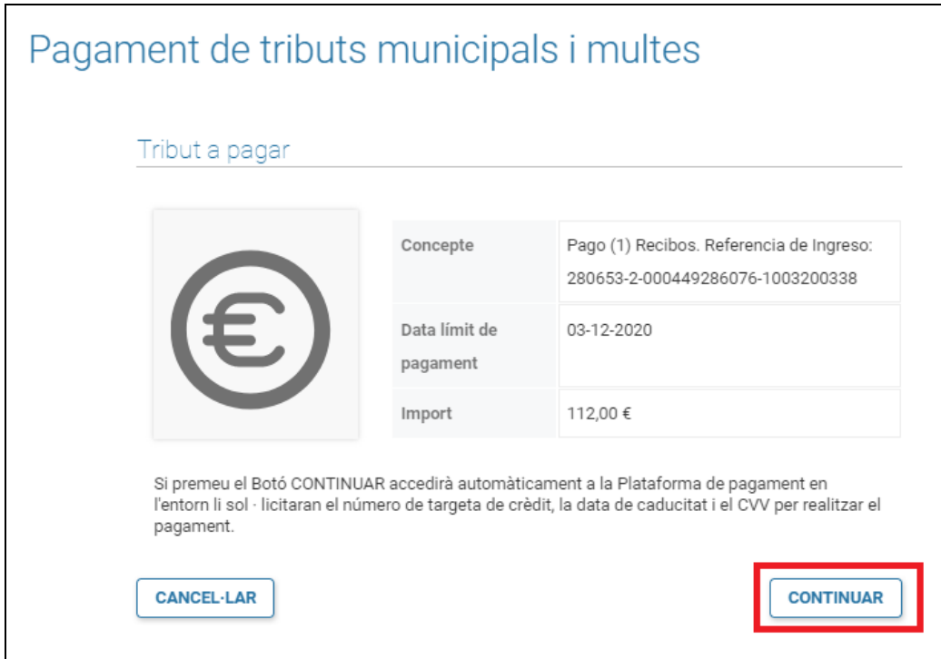
Figura 5. Resumen del pago

Després de prémer el botó de "continuar" de la figura 5 , l'aplicació ens redirigeix a la pàgina del TPV on s'introduiran les dades bancàries (veure figures 6 i 7 ).