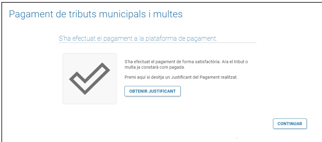
Figura 8. Extracte pagament

Igualment es podrà obtenir el justificant de pagament accedint a la secció de “Els meus rebuts pagats” (Veure figura 9 ).