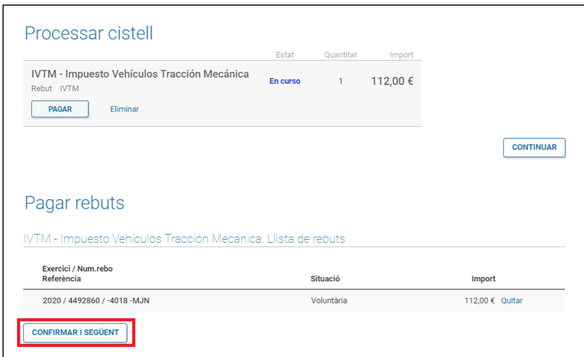
Figura 4. Processament de la cistella

En el següent pas, en la secció de “processar cistella” (veure Figura 4 ), es mostra el conjunt d'elements a pagar. En la secció de “Pagar rebuts” es mostra l'element que es pagarà. A continuació, seleccionem el botó de “Confirmar i següent”.