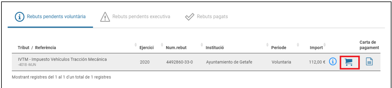
Figura 1. Llista de rebuts pendents

Quan s'accedeixi a la secció de “Rebuts” es mostraran els rebuts pendents i cobrats. Des de cadascun dels rebuts pendents es podrà pagar seleccionant la icona del carret de la compra (veure Figura 1 ).