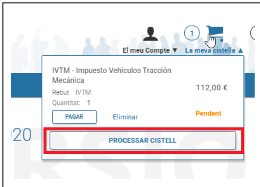
Figura 3. Cistell de la compra

A continuació, el rebut quedarà pendent de pagament i es podrà pagar seleccionant el botó de “processar cistell” que apareix en la icona del carret de la compra visible en la capçalera de la pàgina (veure Figura 3 ).