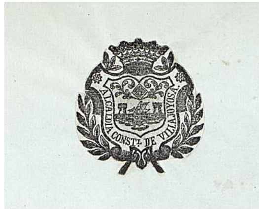
Imagen 1. Escudo de Villajoyosa que figura en la secció de sigilografia de la AHN (1876).