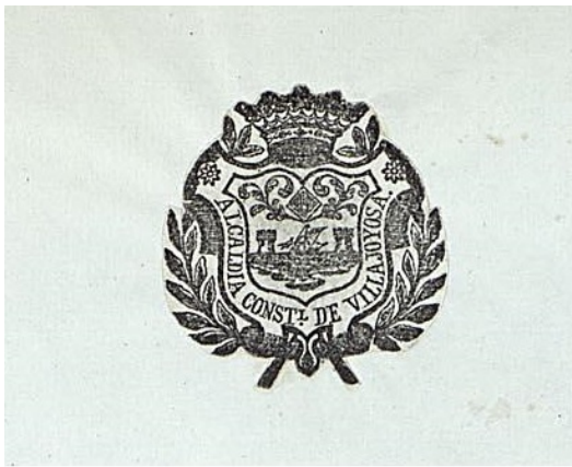
Imatge 1. Escut de La Vila Joiosa que figura en la secció de sigil·lografia de l'AHN (1876).