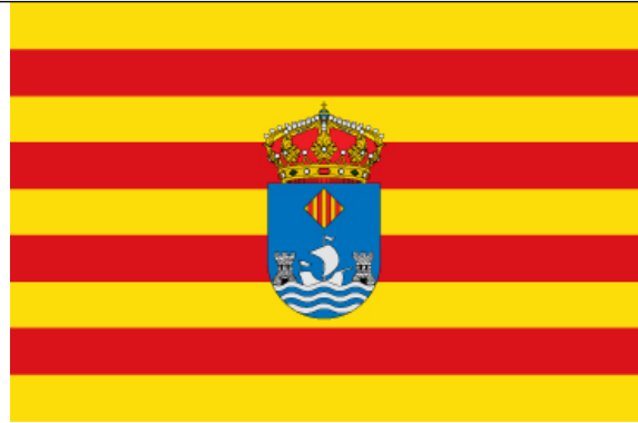
Imagen 6. Bandera oficial de Villajoyosa (1979)

1. Les entitats locals que tinguen aprovat escut