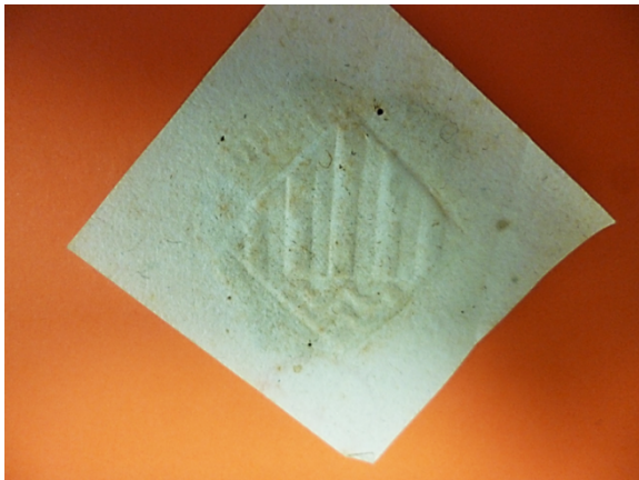
Imatge 7. Segell del Justícia de la Vila Joiosa, 1464.

Concretament coneixent, segons apareix en sengles cartes del justícia de la Vila Joiosa, adreçades als justícies de Cocentina (1464) i de Bocarent (1488), quin seria el segell de dita vila, tal com es pot veure a les imatges 7 i 8,