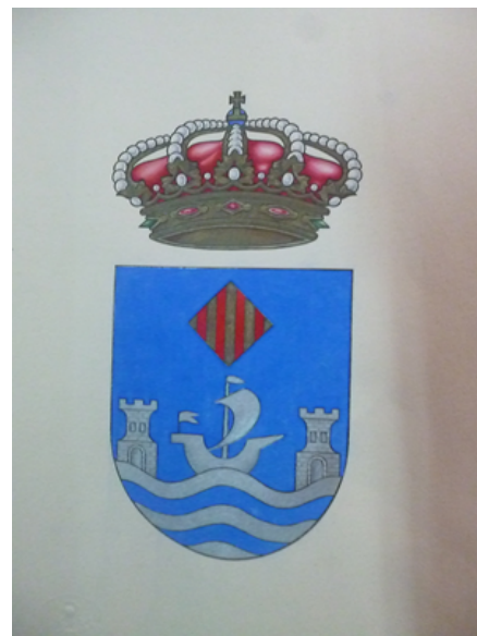
Imagen 2. Propuesta de escudo realizada por el cronista rey de armas Vicente *Cadenas *y Vicent (1974).

Deberá timbrarse el escudo de Armas del Ayuntamiento de Villajoyosa, en la Provincia de Alicante, con una Corona Real de España, que es un círculo engastado en piedras preciosas, compuesto de ocho florines (cinco vistos) de hojas de acanto, interpoladas de perlas y de cuyas hojas salen otras tantas diademas, sumadas de perlas que convergen en un mundo de azur (azul), con el semimeridiano y el ecuador, de oro, sumado de una Cruz, de oro y la Corona forrada de gules (rojo).