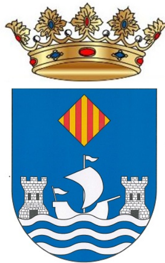
Imagen 4. Propuesta de escudo 1.